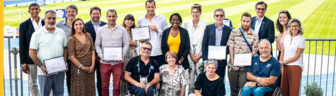
Les finalistes 2023

Le projet d'équipe féminine de Handball Sourd-Pessac veut construire avec des femmes sourdes une équipe de handball adaptée à leur handicap, leur permettre de s'entraîner et de participer à des compétitions.